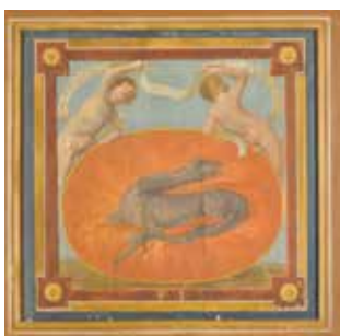
L'emblème du Prince de la Renaissance, François 1 er dans la Galerie des Portraits

Le domaine de Beauregard situé dans le carré d'or Blois - Chambord - Chaumont - Cheverny, fait partie des joyaux du Val de Loire qui laissent un souvenir inoubliable. Le château de Beauregard fut l'un des premiers châteaux classés Monuments Historiques dès 1840. Cet ancien rendez-vous de chasse de François I er , fut la demeure de ministres des rois aux XVI ème et XVII ème siècles. Beauregard n'a cessé de s'embellir au cours des siècles. L'architecture de ce petit château a su garder une certaine simplicité, en ayant conservé les caractéristiques types d'un château Renaissance au fil des propriétaires et de leurs enfants après eux. Toujours habité, il appartient à la même famille depuis 1926.